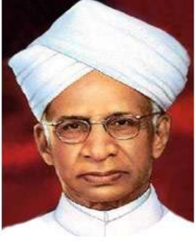
શ્રેષ્ઠ દાર્શનિક વિદ્વાન