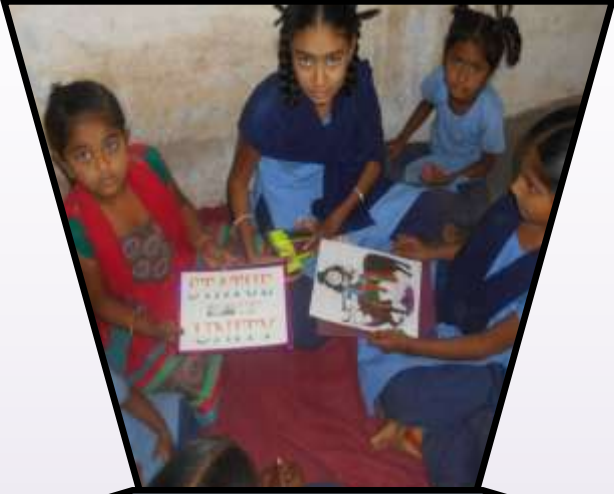
રંગ પૂરણી અને અક્ષર લેખન